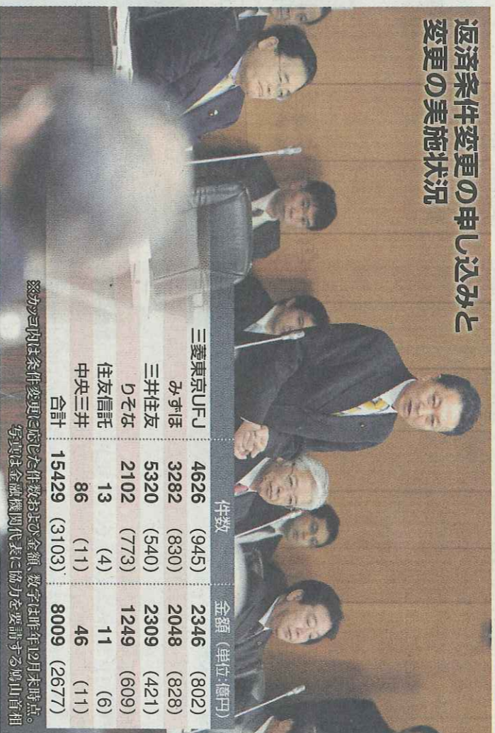
総務省理財局は条件変更に応じた件数を前年12月末時点。写真は金融機関代表に協力を要請する鳩山首相